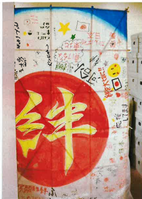
応援メッセージの書かれた旗