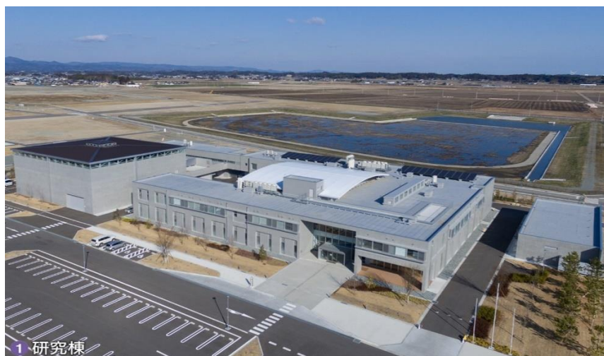
< 試験用プラント >