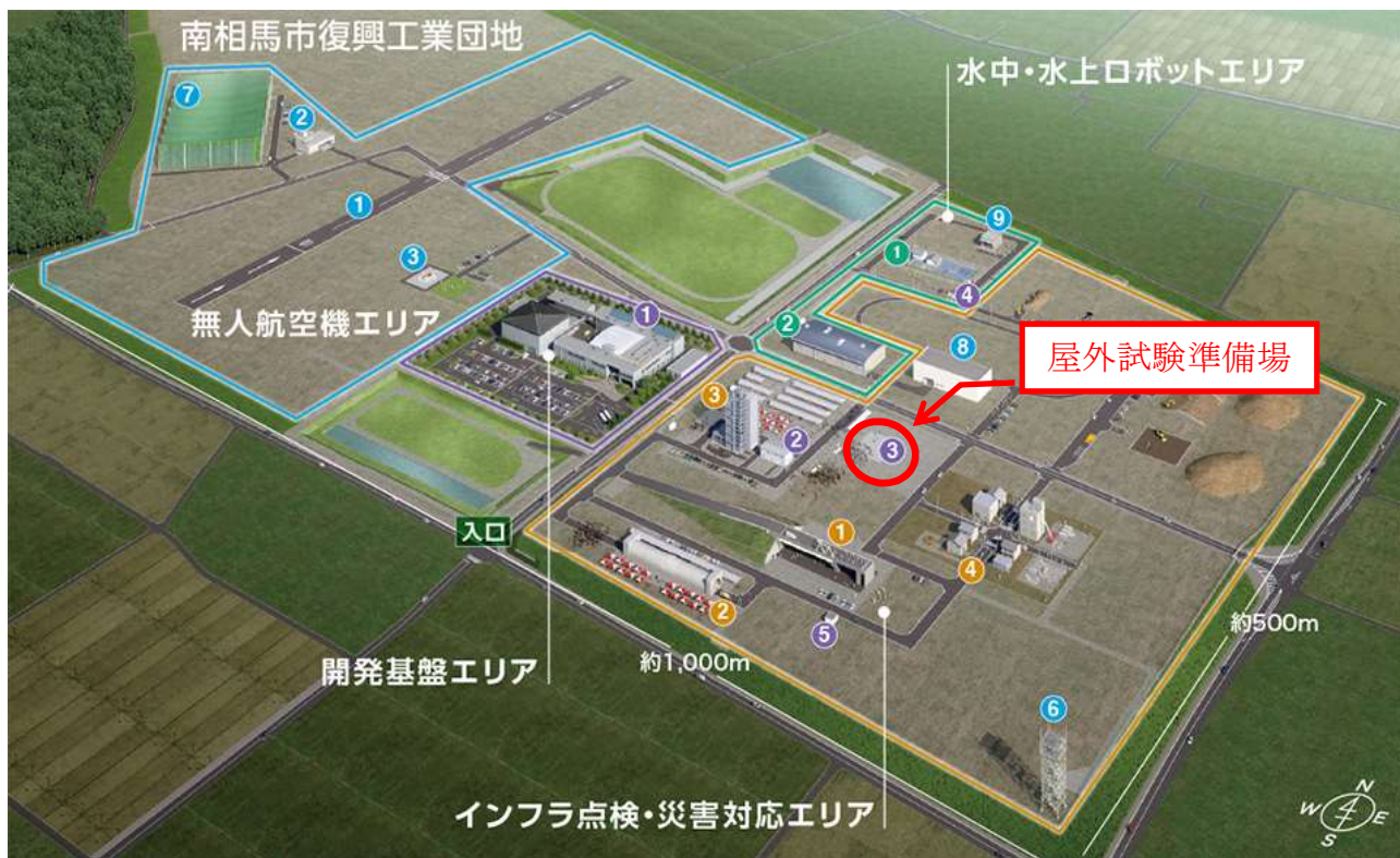
屋外試験準備場設置位置