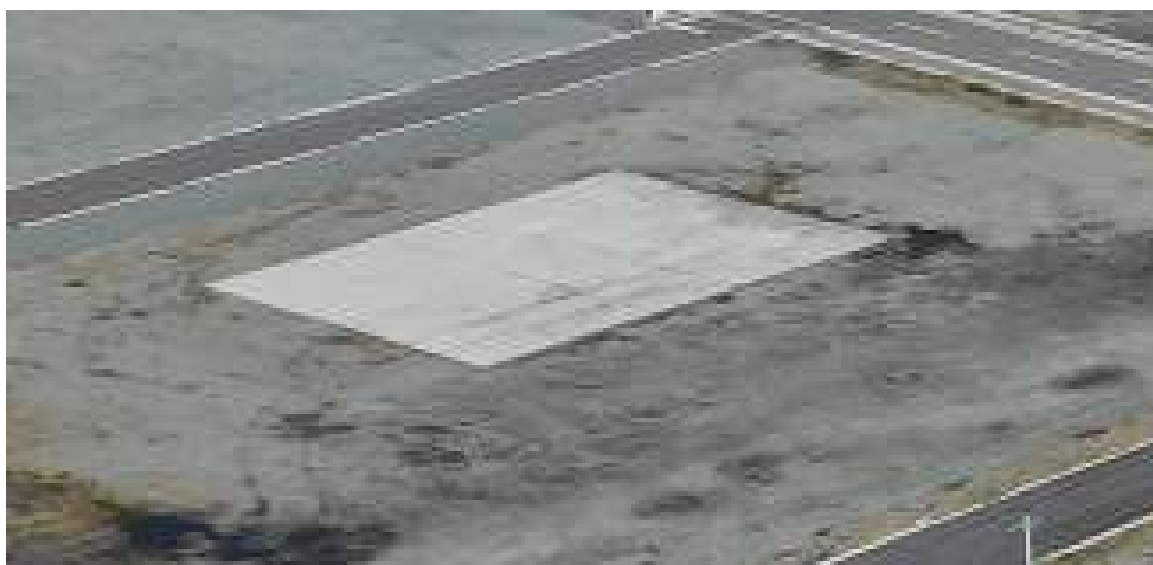
屋外試験準備場外観