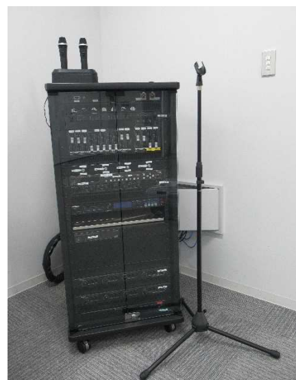
AV機器・マイクスタンド・ワイヤレスマイク