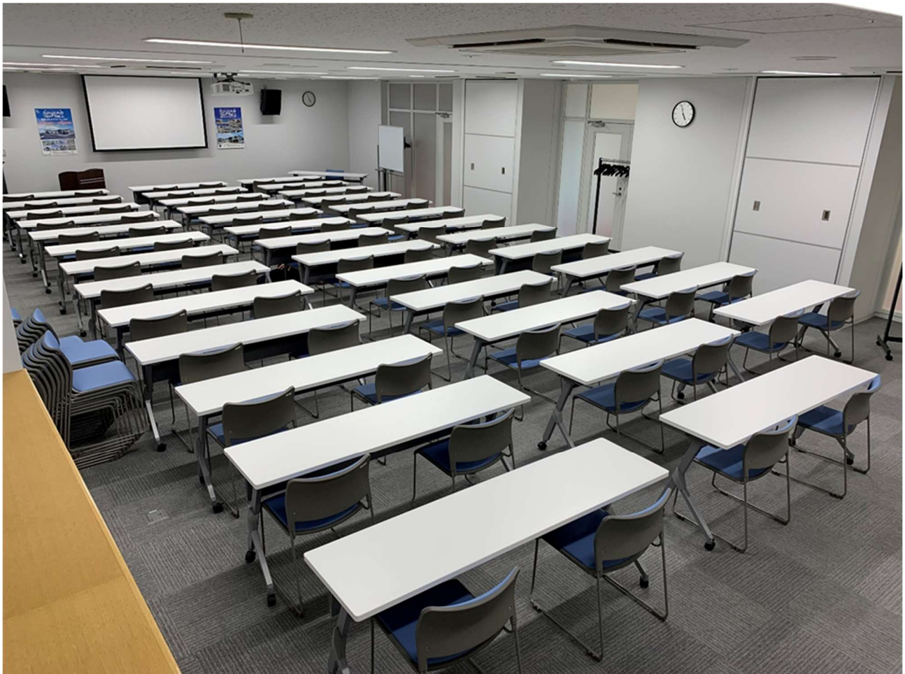
会議室内観 (会議室 1, 2, 3)