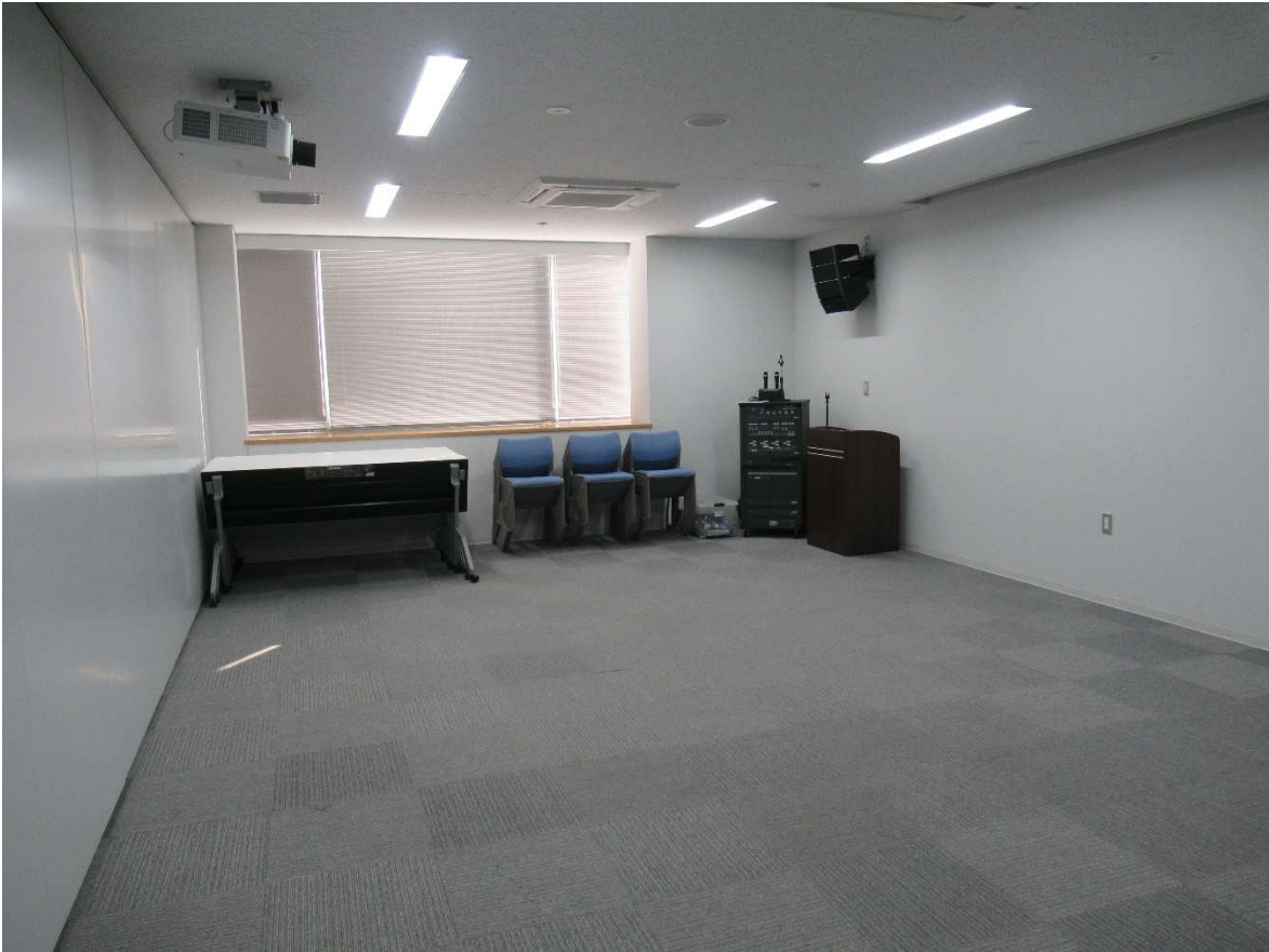
会議室内観(会議室 1)