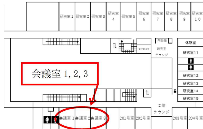
会議室 1, 2, 3 の場所