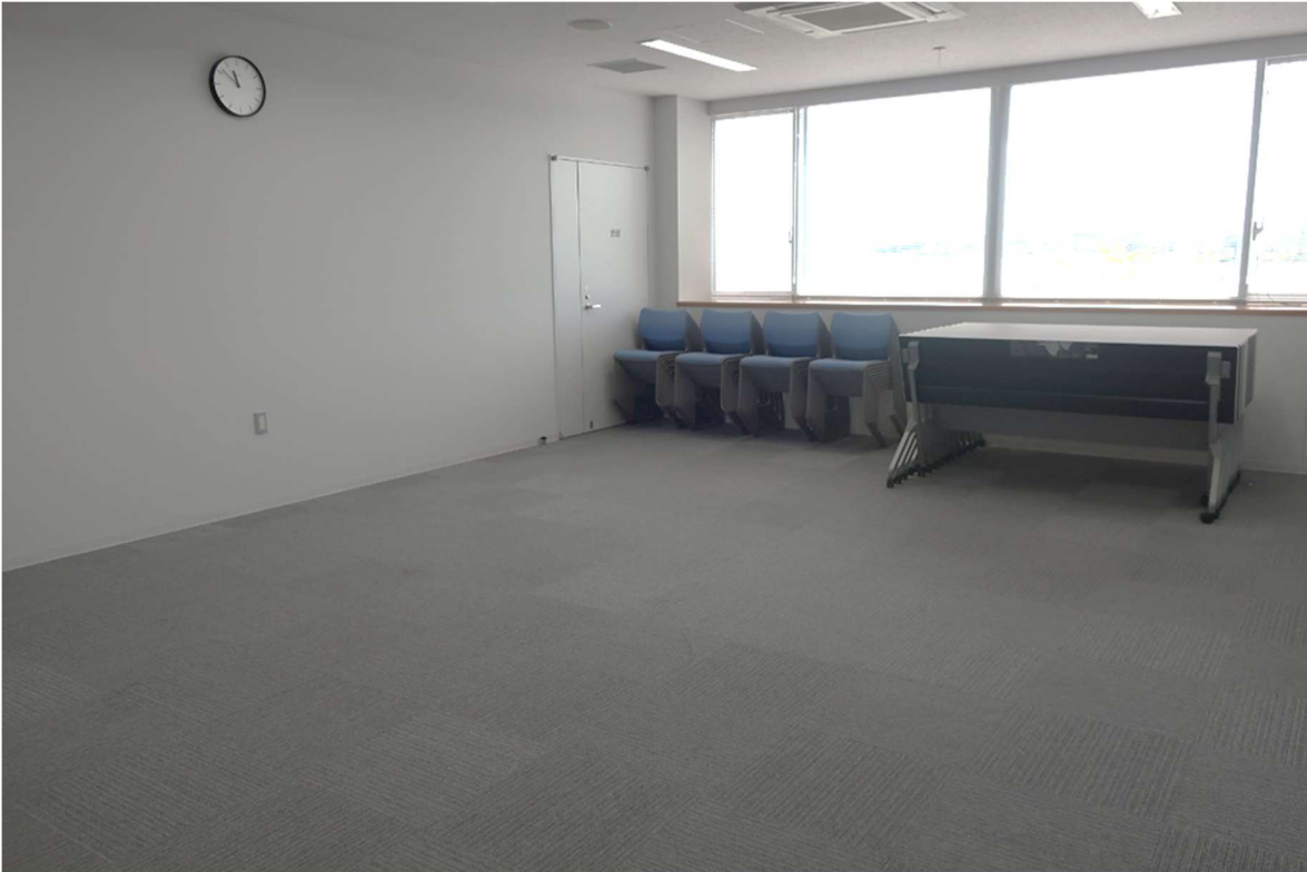
会議室内観(会議室3)