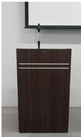
演台、卓上マイクスタンド