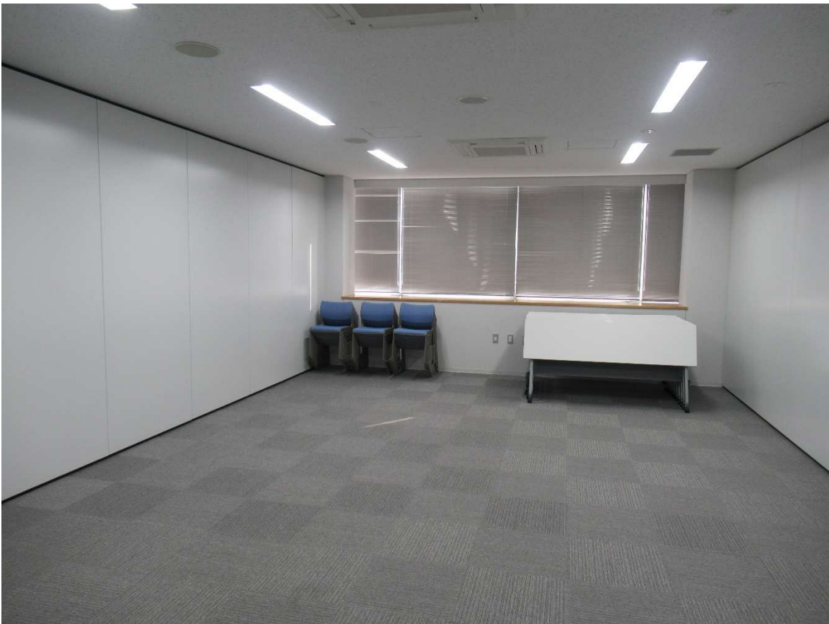
会議室内観(会議室 2)