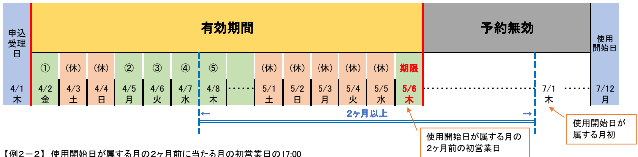
【例2-2】 使用開始日が属する月の2ヶ月前に当たる月の初営業日の17:00