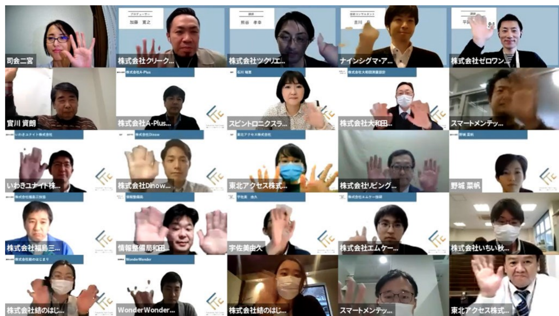
（ピッチイベントの様子）

このライブイベントは、のべ748名が視聴するなど大盛況となり、金融機関等からのお問い合わせ等も多数いただきました。