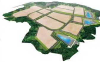
浪江町南産業団地整備イメージ