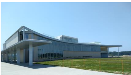
東日本大震災・原子力災害伝承館