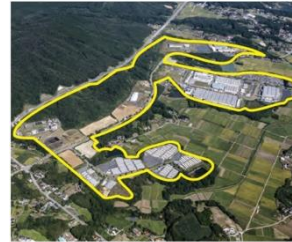
相馬市中核工業団地