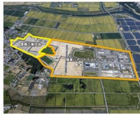
南相馬市復興工業団地