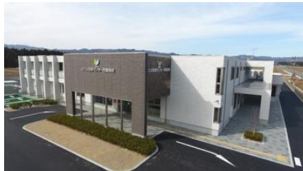
ふたば医療センター附属病院