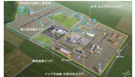
福島ロボットテストフィールド