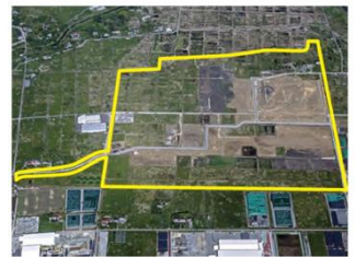
双葉町中野地区復興産業拠点