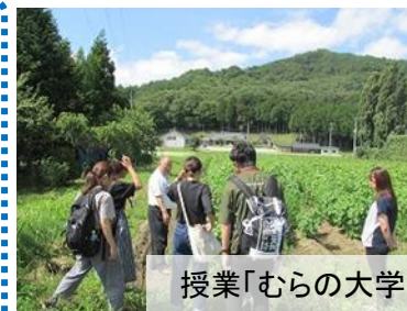
授業「むらの大学」(川内村・南相馬市)