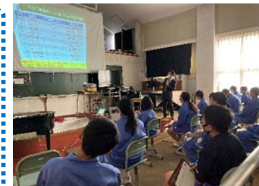
『「復興知」エクステンション」展開(写真は中学校での「復興知」授業)