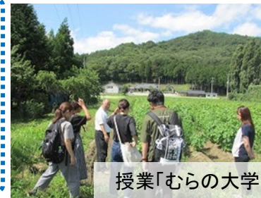
授業「むらの大学」(川内村・南相馬市)