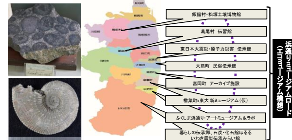
自治体・地元施設等と連携した人材育成と地域活性化