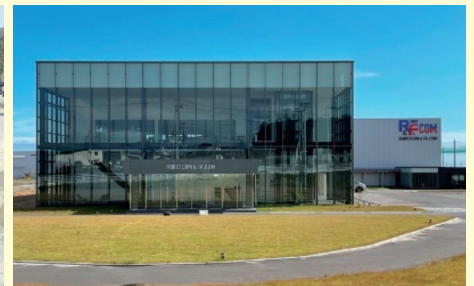
ロボコム・アンド・エフエイコム(株)