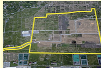
双葉町中野地区復興産業拠点