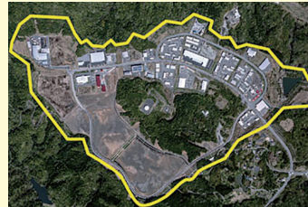
いわき四倉中核工業団地