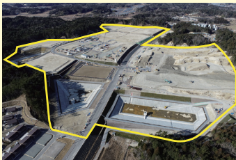
浪江町南産業団地