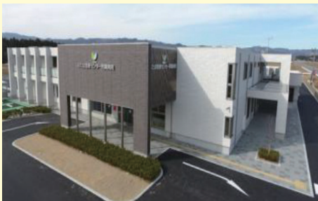
ふたば医療センター附属病院