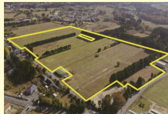
大熊中央産業拠点