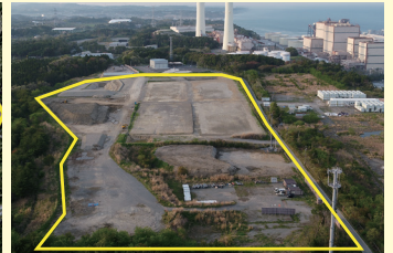
広野町東町産業団地