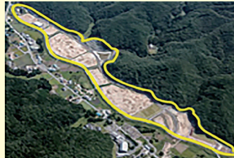
田ノ入工業団地 (川内村)