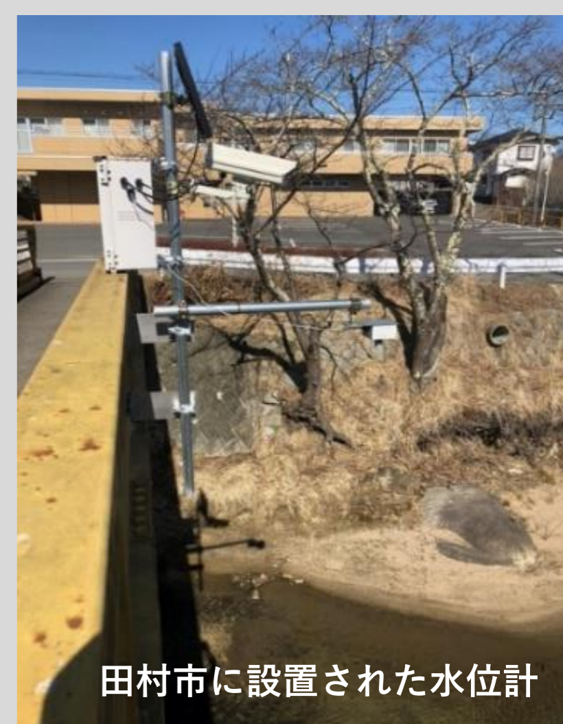
田村市に設置された水位計