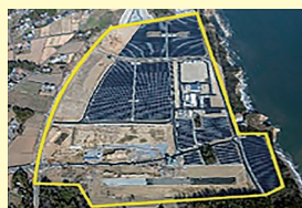
浪江町棚塩産業団地