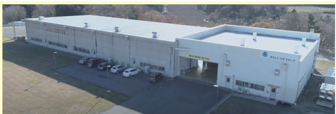
(株)フォーオールエナジー 浪江事業所