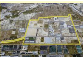
双葉町中野地区復興産業拠点