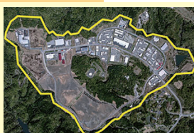
いわき四倉中核工業団地