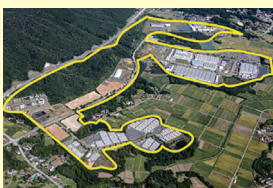
相馬中核工業団地 (西地区)