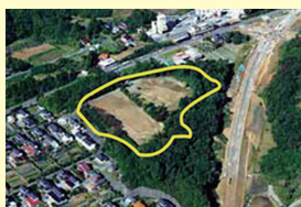
駒ヶ嶺工業用地 (新地町)