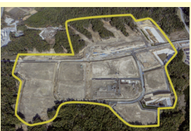
浪江町南産業団地