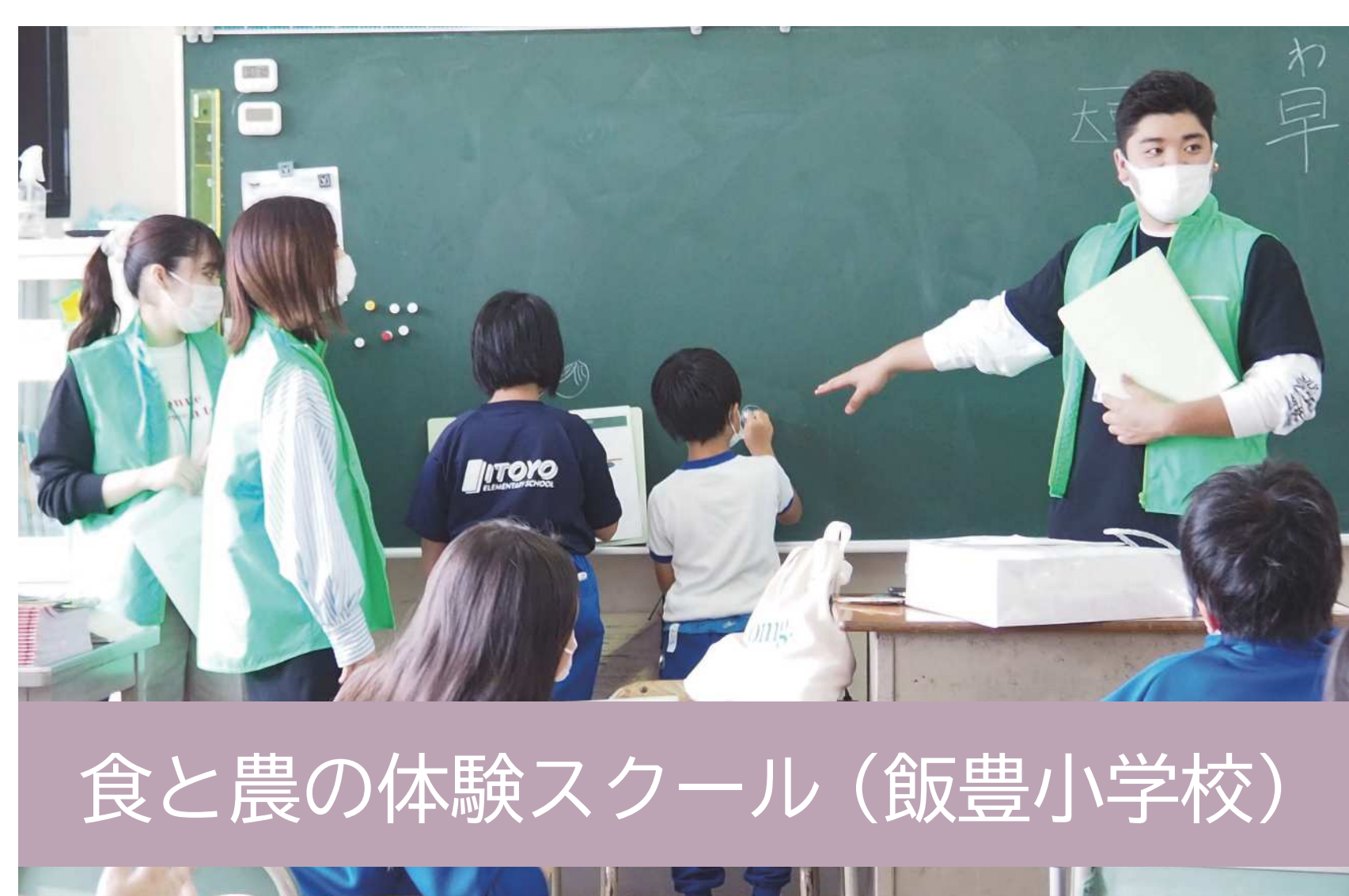
食と農の体験スクール (飯豊小学校)