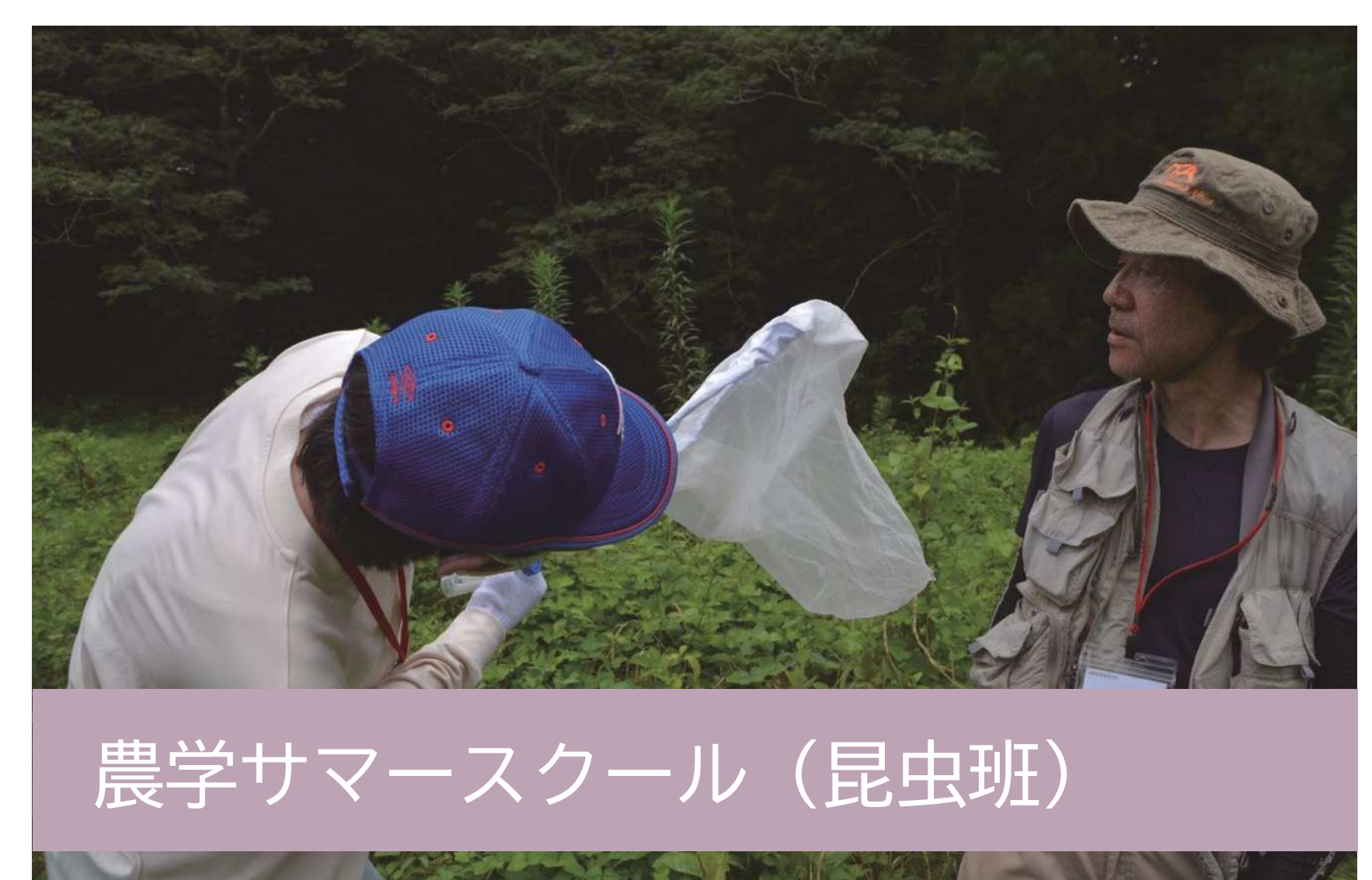
農学サマースクール (昆虫班)