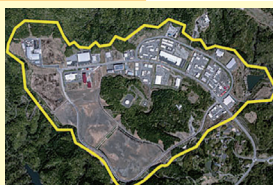
いわき四倉中核工業団地