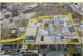
双葉町中野地区復興産業拠点