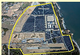
浪江町棚塩産業団地