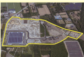
檜葉北産業団地 (檜葉町)