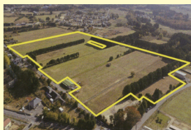
大熊中央産業拠点 (大熊町)