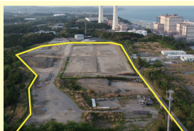
東町産業団地 (広野町)