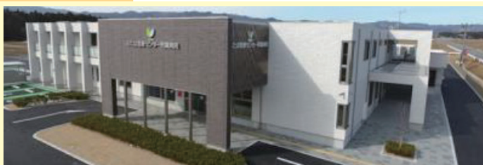
ふたば医療センター附属病院 (富岡町)