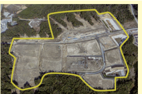
浪江町南産業団地