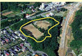
駒ヶ嶺工業用地 (新地町)