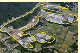
相馬中核工業団地 (西地区)