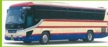
運行バス会社：福島交通

ー 西口 バスパール ー 2階新幹線改札口を出て、階段かエレベーターで1階に降りて、西口出口を出てください。右手の赤枠内に停車の貸切バス前でお待ちしております。