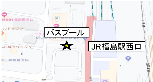
JR福島駅西口バスプール⑤乗り場付近