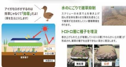
アイガモロボット導入セミナー