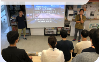
小高パイオニアヴィレッジ