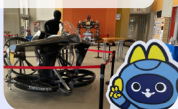
福島ロボットテストフィールド